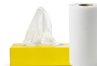
Mouchoirs & essuie-tout