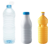
Bouteilles en plastique