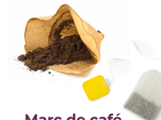
Marc de café & sachets de thé