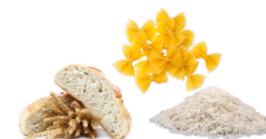
Pains, sandwichs, pâtes, riz & gâteaux