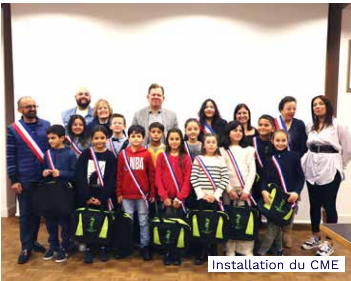
Installation du CME