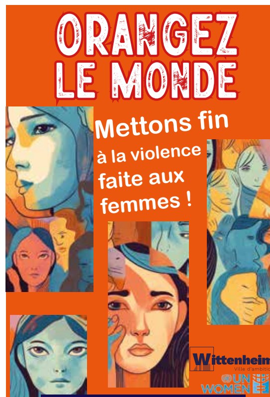
Communication grand format novembre 2023

La question de la prévention des violences, et plus généralement de la prévention de toutes formes de discriminations sont également des sujets qui seront approfondis dans ce cadre.