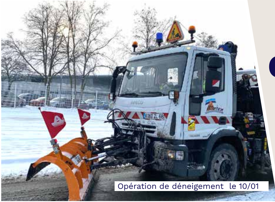
Opération de déneigement le 10/01