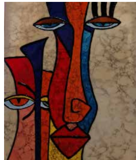
Exposition « Art'K'en ciel »

13 avril Crescendo de printemps Ecole de musique et de danse 17h Salle A. Camus