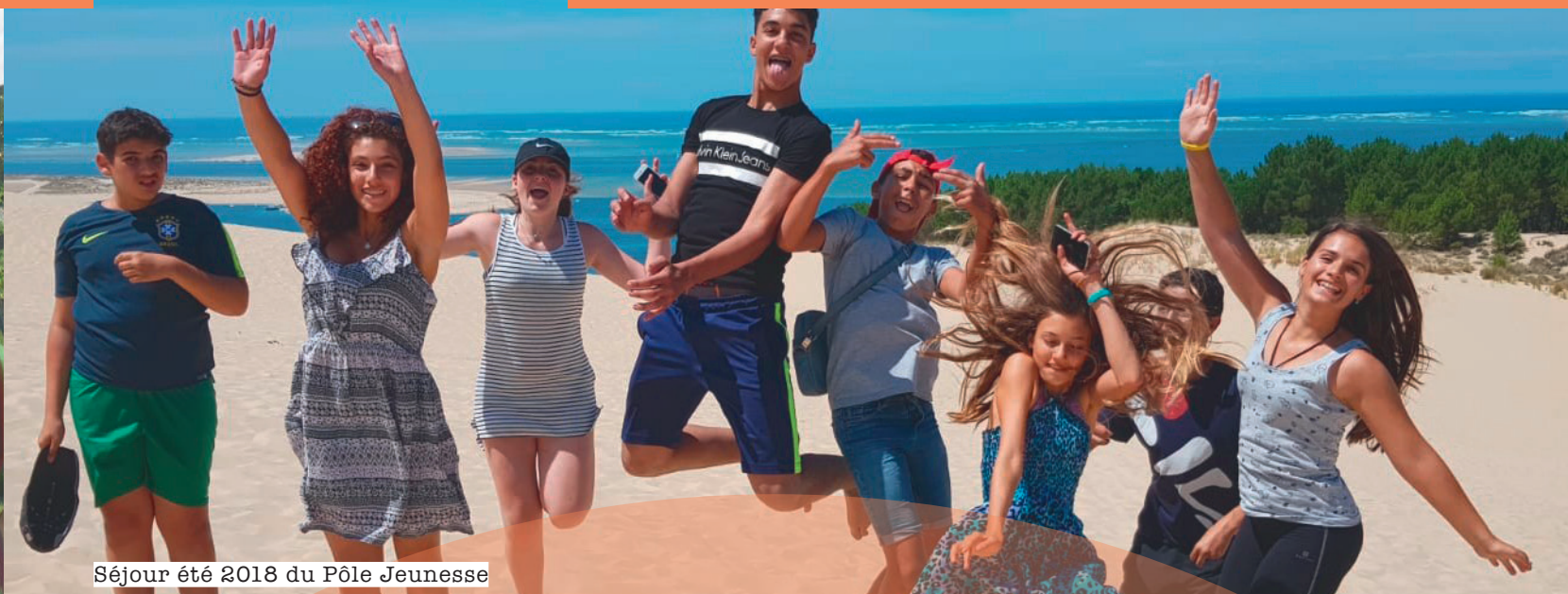
Séjour été 2018 du Pôle Jeunesse