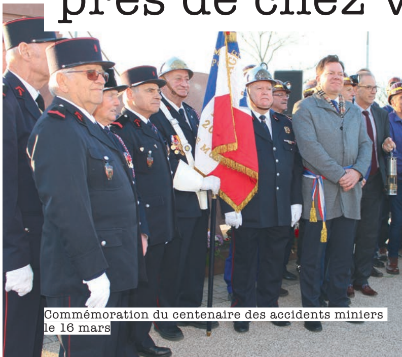
Commémoration du centenaire des accidents miniers le 16 mars