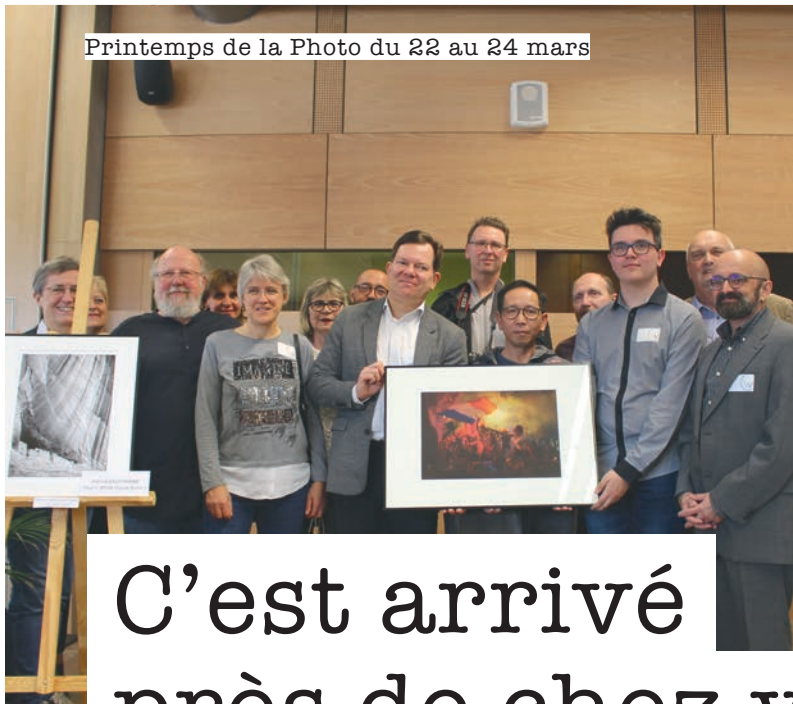
Printemps de la Photo du 22 au 24 mars