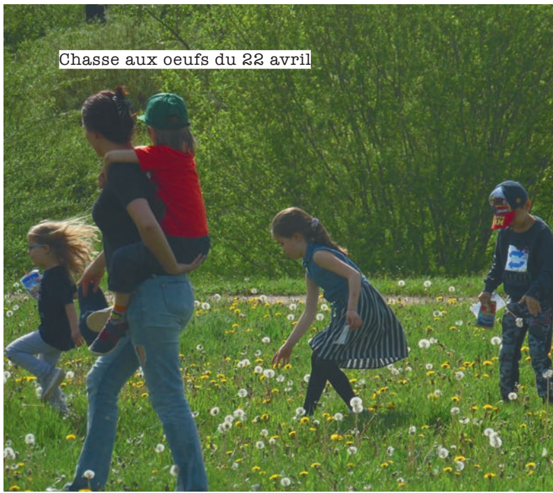
Chasse aux oeufs du 22 avril