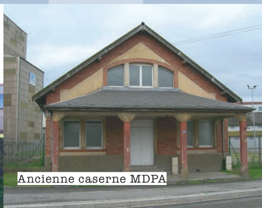
Ancienne caserne MDPA