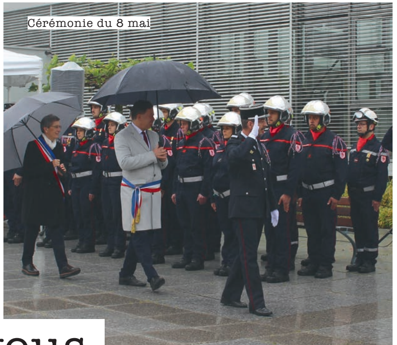
Cérémonie du 8 mai