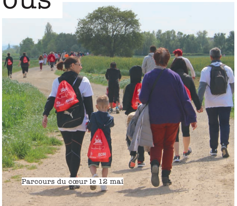
Parcours du cœur le 12 mai