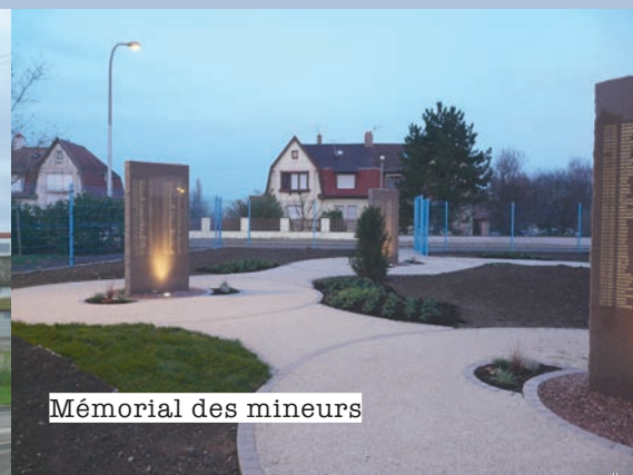
Mémorial des mineurs