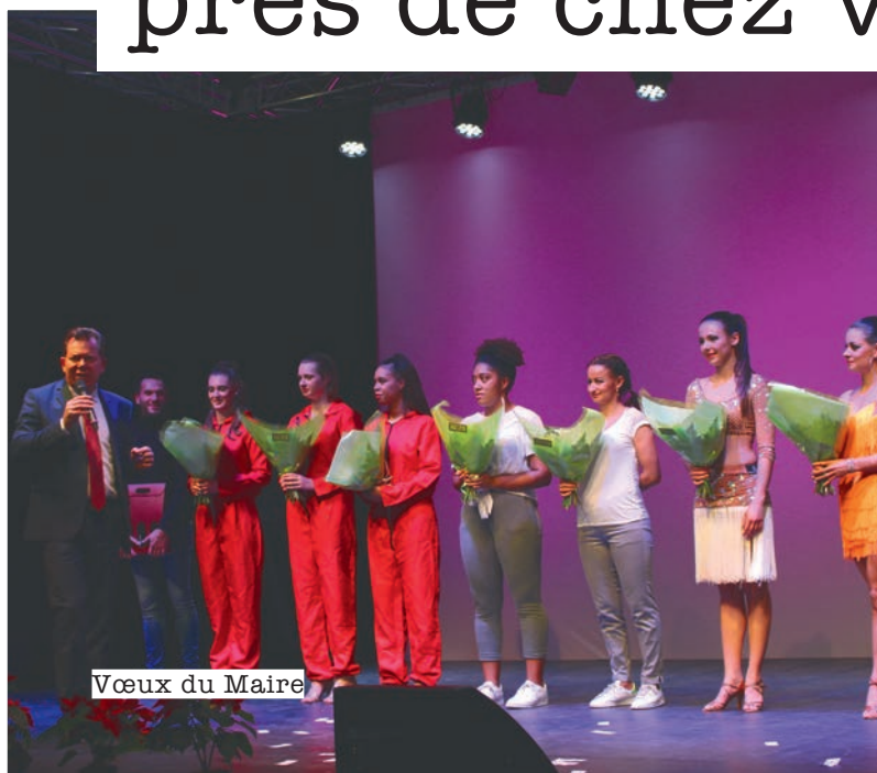
Vœux du Maire