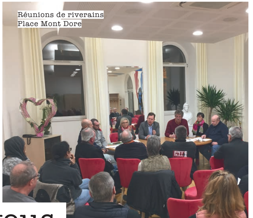
Réunions de riverains Place Mont Dore