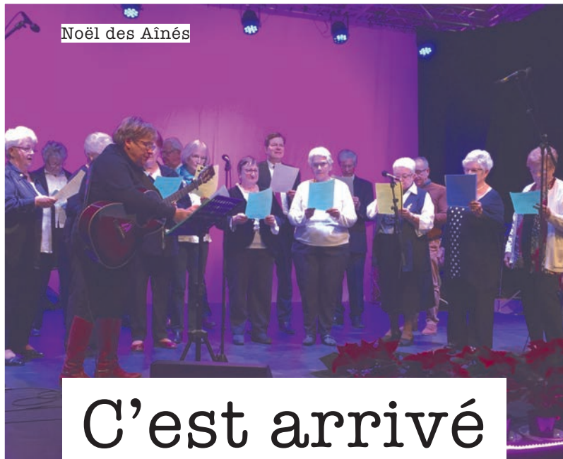
Noël des Aînés