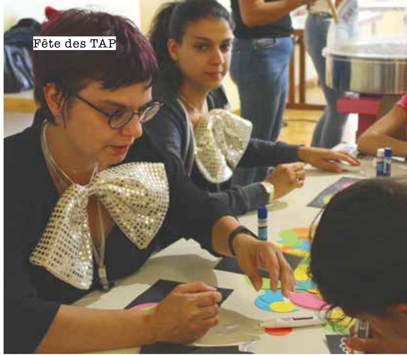
Fête des TAP