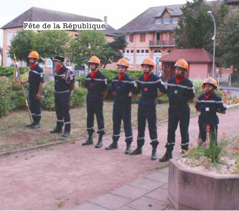
Fête de la République