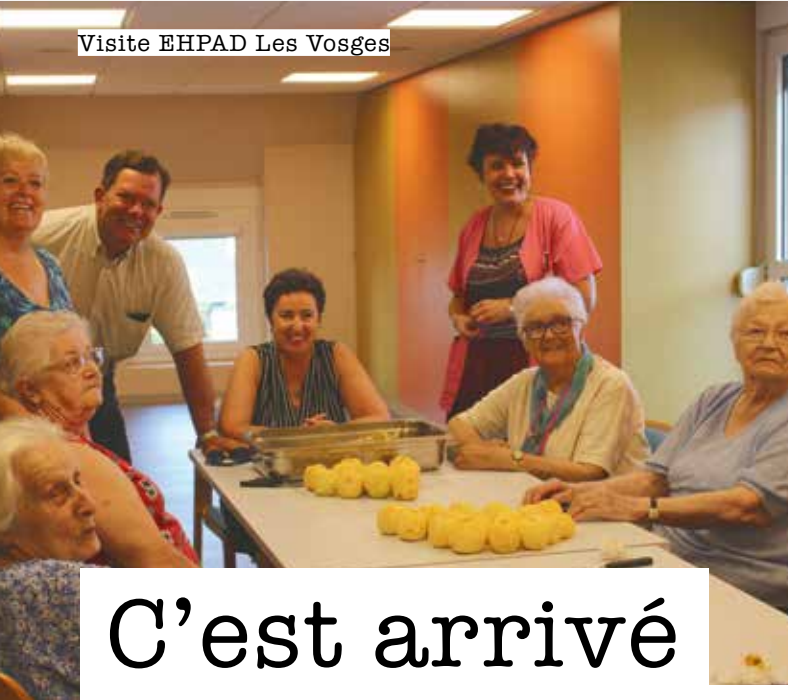
Visite EHPAD Les Vosges