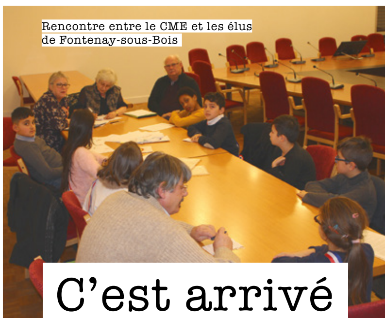
Rencontre entre le CME et les élus de Fontenay-sous-Bois