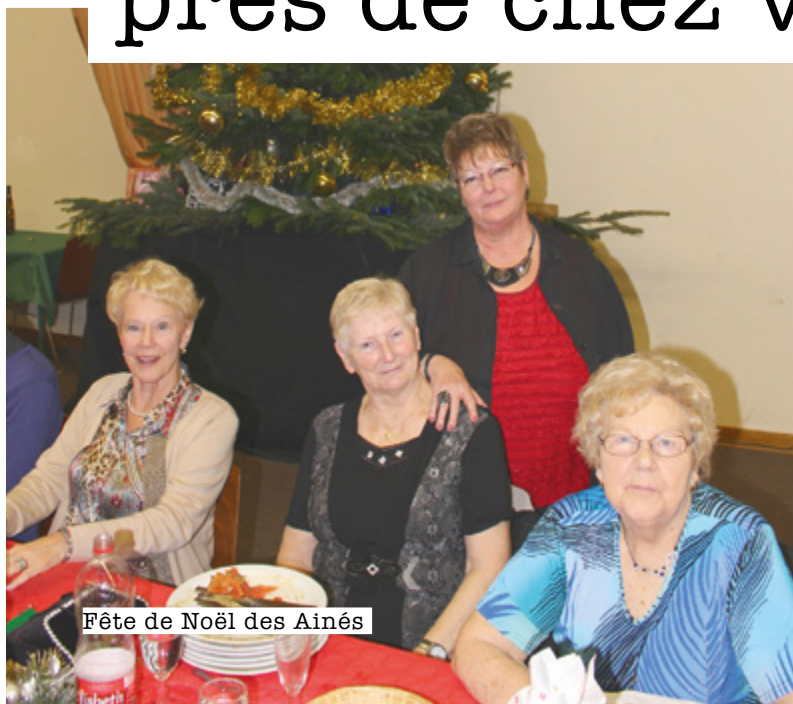
Fête de Noël des Aînés