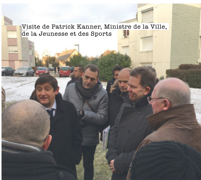
Visite de Patrick Kanner, Ministre de la Ville, de la Jeunesse et des Sports