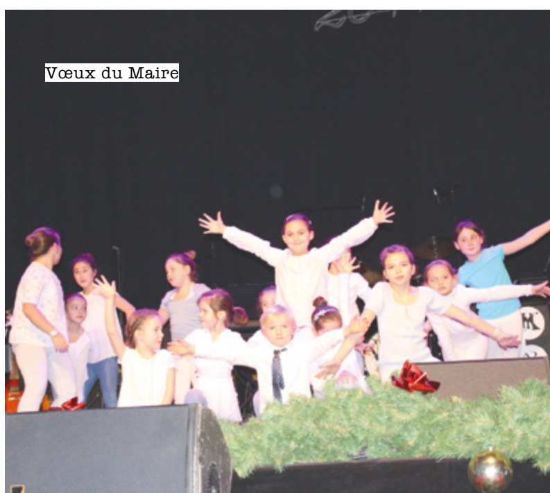
Vœux du Maire