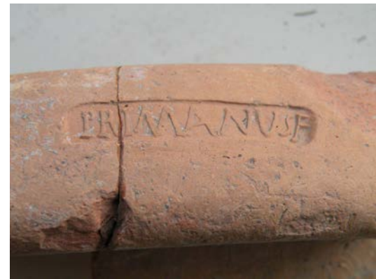
Poterie portant le nom de son fabricant : Primanus

Une partie de la cave de la villa rurale de cette époque, appareillée en moellons de pierre calcaire dits "quadrata" fut exhumée et remontée à l'identique place de Thiers où elle se trouve exposée depuis 1979.