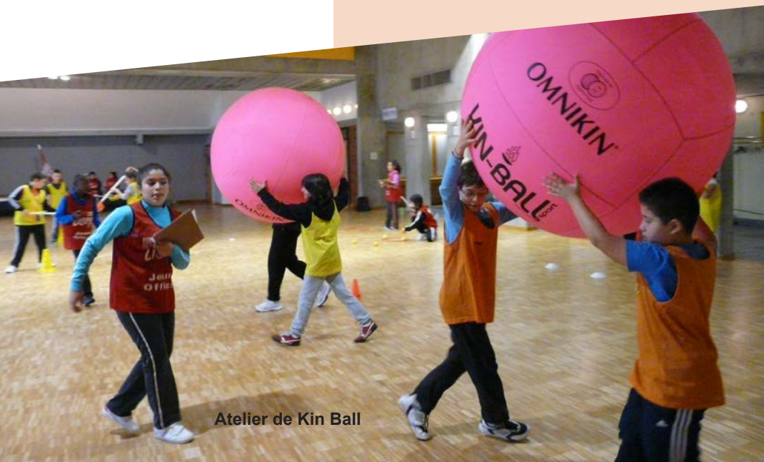
Atelier de Kin Ball

Le collège Joliot-Curie propose, quant à lui, la section judo.