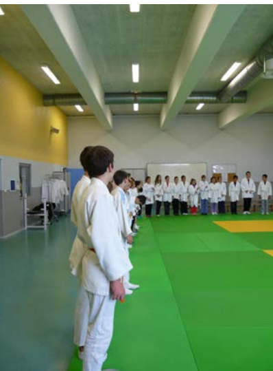
Atelier judo du collège Joliot-Curie