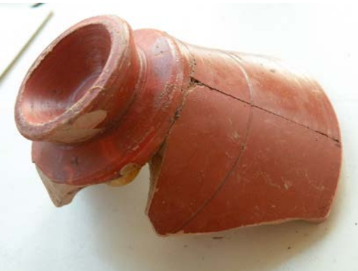
Gobelet en sigillée, céramique fine destinée au service à table

De même certains débris significatifs de l'habitat témoignent du cadre de vie d'il y a bientôt deux mille ans : clous de charpente, tuiles, tessons de verre à vitre, fragments d'enduis intérieurs colorés, etc.