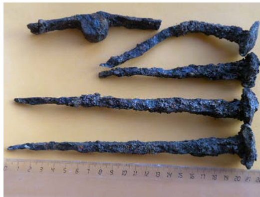
Clous de charpente