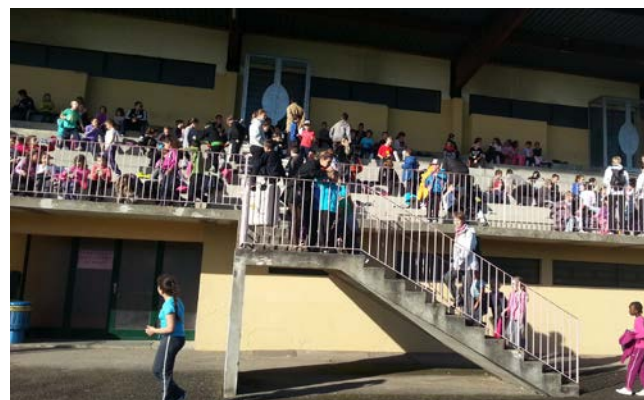
Les élèves des écoles élémentaires de Wittenheim se préparent à la course longue.