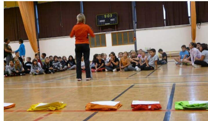
Accueil des élèves à Léo Lagrange

Les collégiens étaient pris en charge dans leurs établissements respectifs. Les sections sportives de Wittenheim ont animé certains ateliers comme celui de judo au Collège Joliot-Curie.