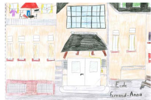
Anna GWINNER - 1er prix cycle 3