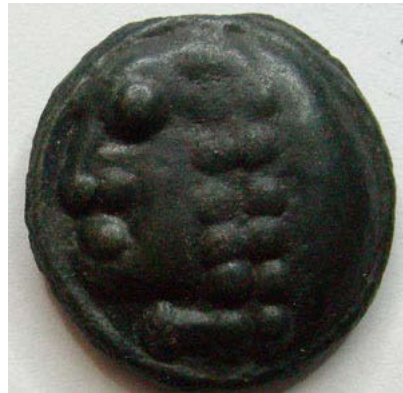
Potin à la grosse tête