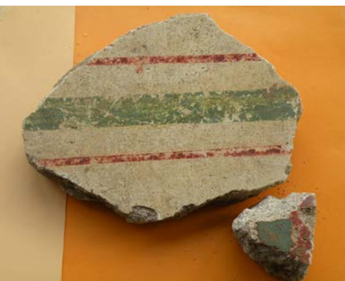
Parement intérieur de la villa