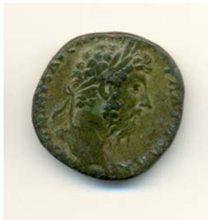
Sesterce de Marc Aurèle