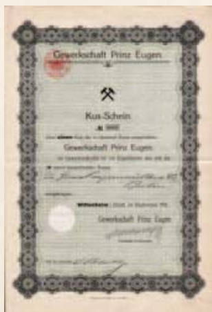
Statuts de la Gewerkschaft Prinz Eugène

L'instituteur Schmidt consigne l'état des lieux en 1917. Il indique que l'Arbeiterkolonie Sankt Barbara réunit 32 maisons doubles et 10 maisons mono-familiales. Il évoquait les maisons actuellement desservies par les rues d'Ensisheim, ainsi que les rues Rapp et Kléber. Un grand immeuble locatif servant aussi d'auberge sous le nom de Bergmansruh fut érigé au carrefour de la rue d'Ensisheim avec le chemin vicinal menant à Pulversheim. Un peu plus au sud, face à la colonie, un immeuble, appartenant à la société minière et offrant plusieurs logements, est également donné pour avoir été construit avant 1914.