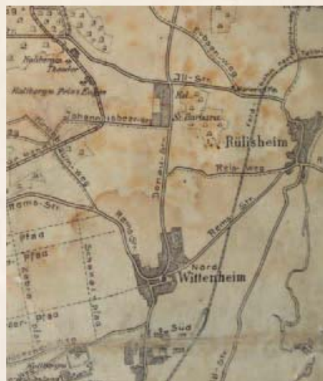
Carte de la Colonie Sainte-Barbe - Carte militaire allemande 1918

La nouvelle colonie connut la guerre à divers titres. En août 1914, le gérant-policier, en charge de la colonie ouvrière, fut dénoncé auprès des Français pour avoir renseigné les troupes allemandes sur leurs mouvements. Il fut arrêté et déporté en France en tant qu'otage, de même que le gérant du Casino. Certains bâtiments miniers furent réquisitionnés pour les soins aux blessés lors des deux offensives françaises en août 1914. Par la suite, dès janvier 1915, suite aux combats meurtriers des Vosges, l'armée impériale y agença un hôpital militaire de campagne, le Feldlazarett 15. En face, sur le ban de Ruelisheim, le cimetière pour les braves, Waldfriedhof, situé fut visité par l'empereur Guillaume II et le Kronprinz le 23 septembre 1915. La stèle en grès rose située en bordure de route en reste l'unique témoin. Rappelons encore que la zone boisée dite du Niederweiher (actuel parcours sportif) abrita à partir de janvier 1917 un camp de prisonniers roumains rattachés au XIII e Rumänen Commando, affecté aux travaux agricoles et forestiers. Ces hommes furent littéralement affamés et l'on déplore le décès de 21 d'entre dans les semaines qui suivirent.